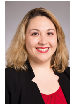
Hélène BIDARD , Adjointe à la Maire de Paris en charge de l'égalité femmes-hommes, des discriminations et des droits humains

Remerciements également à toutes les intervenantes et tous les intervenants, institutions partenaires et expert-es, ainsi qu'à la MIPROF (Mission interministérielle de protection des femmes contre les violences et de lutte contre la traite des êtres humains), pour ses initiatives et ses conseils.