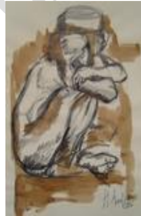
Etude de nu – 30 x 40 cm