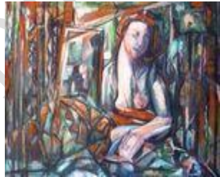
Femme à la fenêtre – 80 x 60 cm