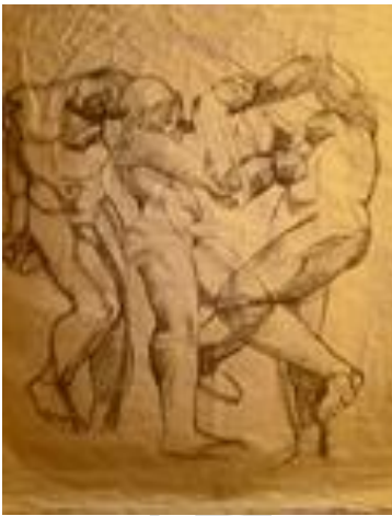
La danse – 70 x 85 cm