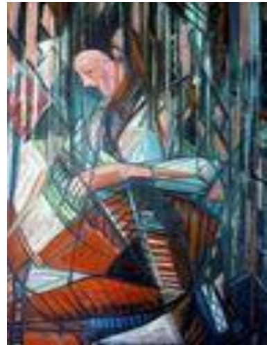
Sans titre – 60 x 100 cm