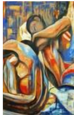
Entre deux – 65 x 100 cm