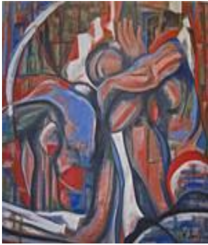
Entre deux I