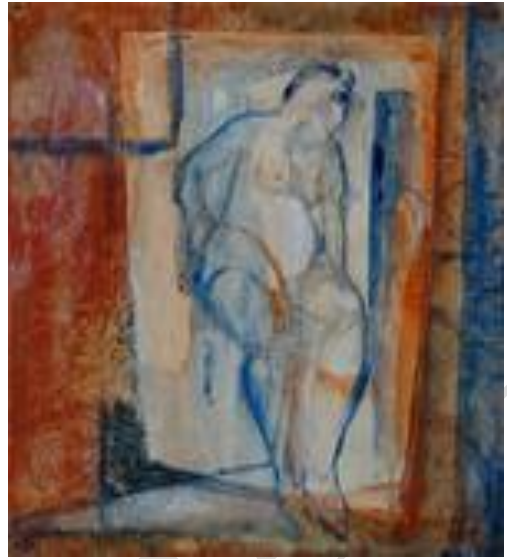
Maternité – 20 m x 20 m