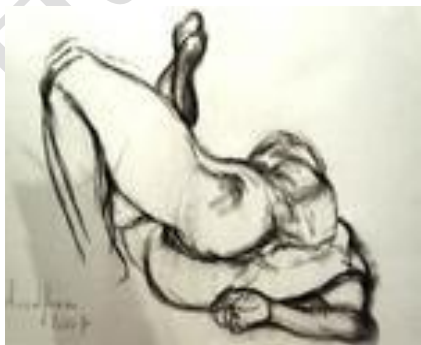
Nu couché – 70 x 100 cm