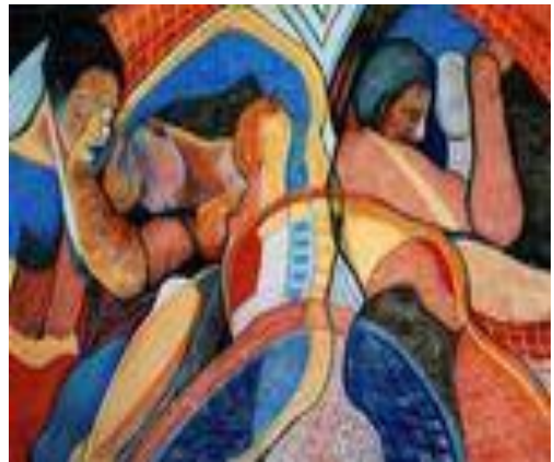
Mouvements – 80 x 120 cm