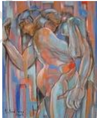
Rencontre - 54 x 73 cm