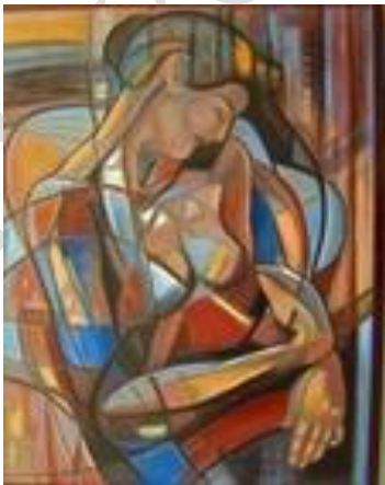
Le sommeil – 60 x 80 cm