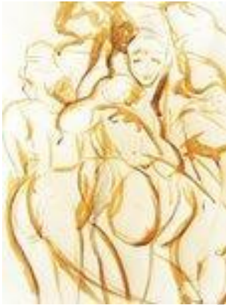
ICI, AILLEURS – 70 x 100 cm