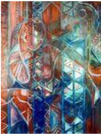
Etat d'âme – 60 x 80 cm