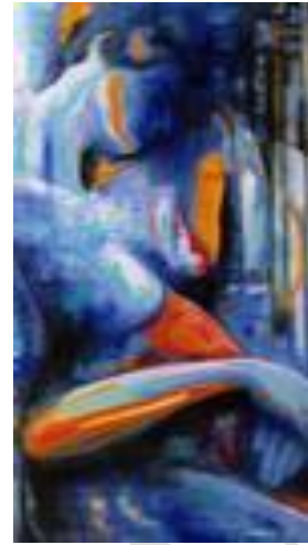
Rêve en bleu – 100 x 50 cm