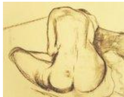
Hors des regards – 100 x 70 cm