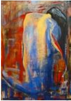
Entre rouge et noir – 65 x 80 cm