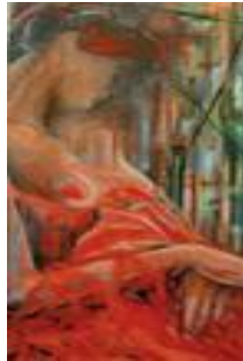
Rêve en rouge