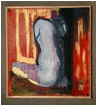
Le corps ému - 20 x 20 cm