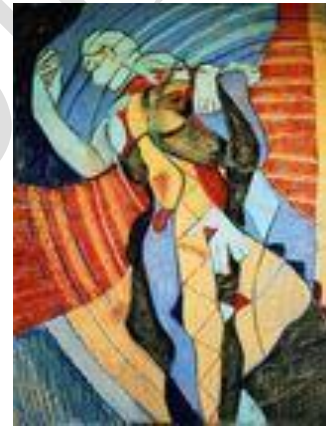
Féminin Masculin II – 50 x 70 cm