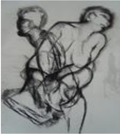
Pesanteur – 100 x 70 cm