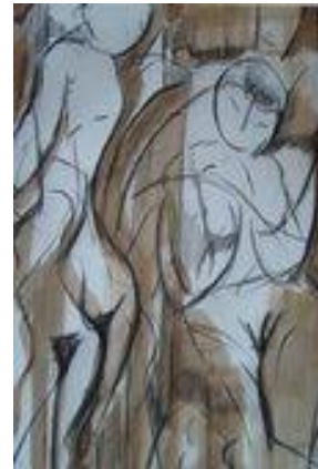
Espérance – 50 x 75 cm