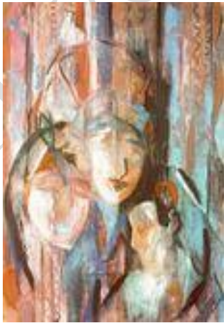
Devenir – 50 x 65 cm