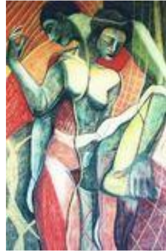
Féminin Masculin – 80 x 120 cm