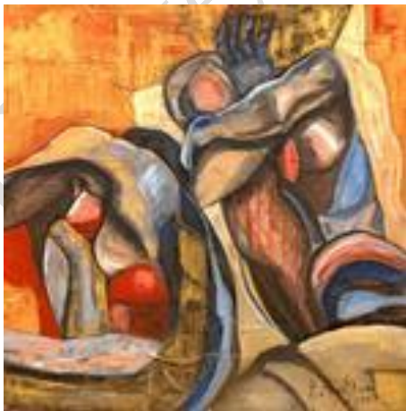
Entre deux II