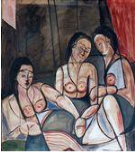
Confidences – 105 x 105 cm