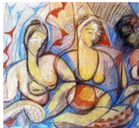
Volupté II - 92 x 92 cm