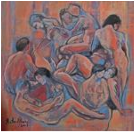
La ronde - 40 x 40 cm