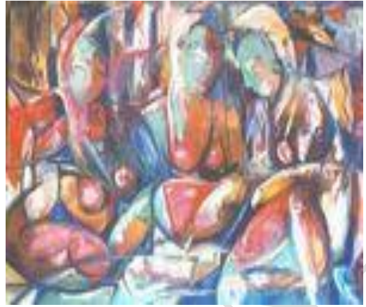
Confidences II – 85 x 125 cm