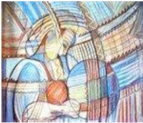
Naissance – 85 x 125 cm